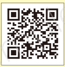
プレミアム商品券 専用ホームページ 【事業者様向けページ】

「いわた応援チケットプレミアム」取扱店を募集しています。 詳細は、磐田市プレミアム付商品券事務局までお問合せいただくか、専用ホームページをご確認ください。