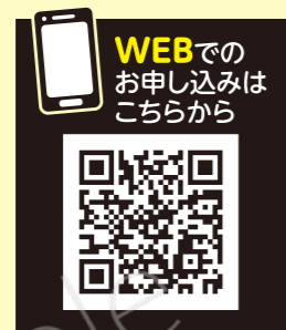
【申込締切】 6/19(金) 23:59まで

紙商品券をハガキでお申し込みの方 申込書(中面)に必要事項を記入後、ミシン目に沿ってチラシから切り取り、そのままポストに投函してください。